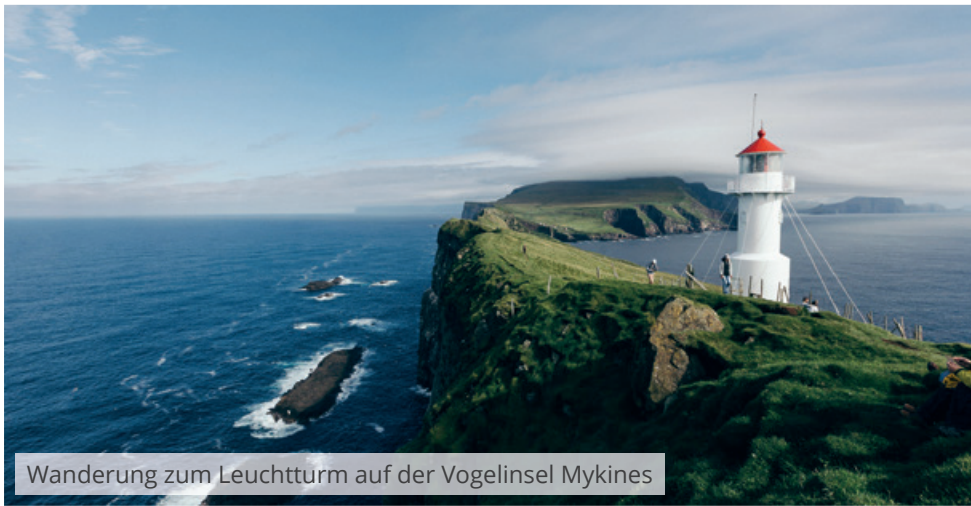
Wanderung zum Leuchtturm auf der Vogelinsel Mykines