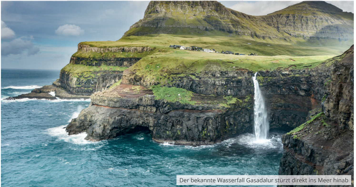
Der bekannte Wasserfall Gasadalur stürzt direkt ins Meer hinab