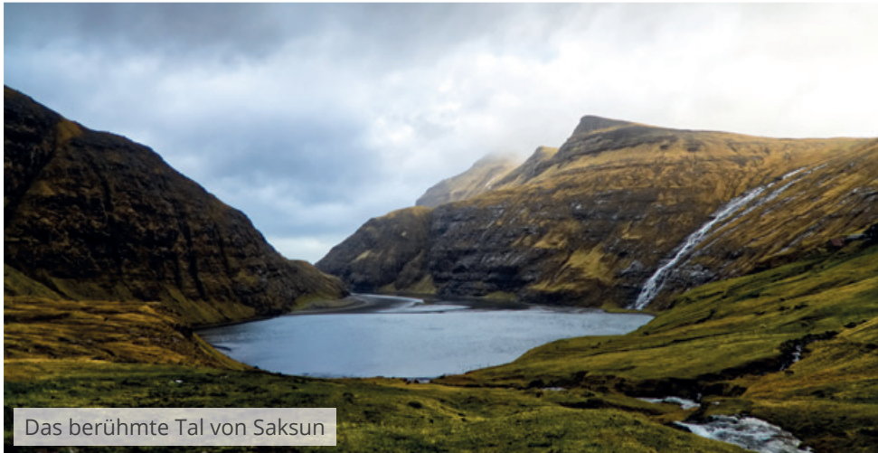
Das berühmte Tal von Saksun