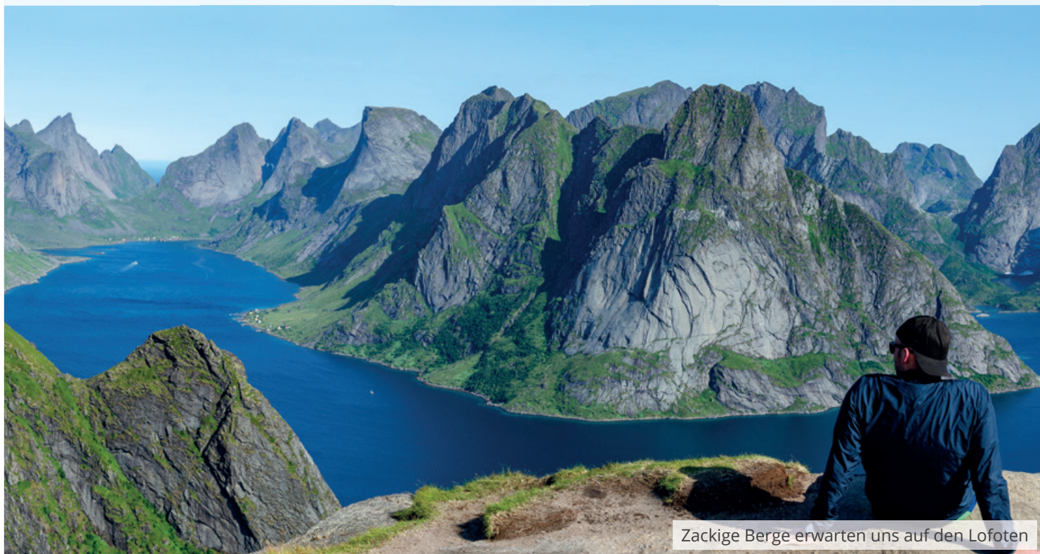
Zackige Berge erwarten uns auf den Lofoten