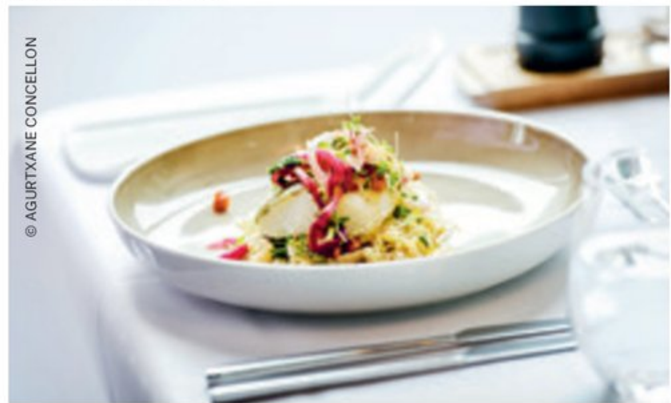
Feinste Speisen à la carte serviert