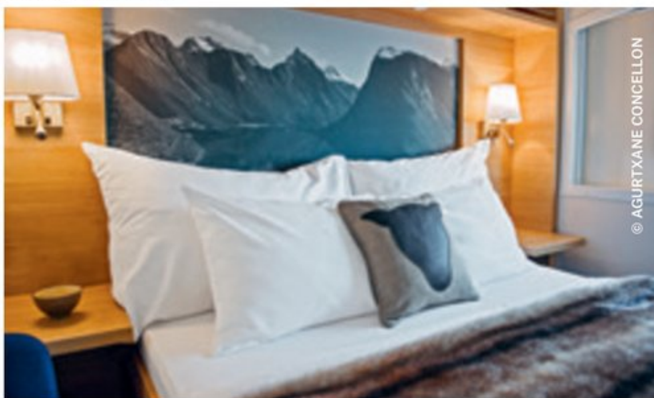
EXPEDITION Suite (Mini-Suite)