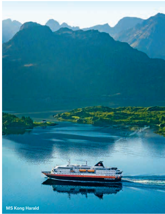
MS Kong Harald