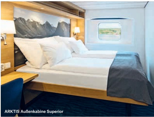
ARKTIS Außenkabine Superior

KABINEN: 221 UND 2 SUITEN BRZ: 11.204 BAUJAHR: 1993 LÄNGE: 121,8 METER MODERNISIERUNG: 2016 UND 2022 BREITE: 19,2 METER WERFT: VOLKSWERFT, DEUTSCHLAND GESCHWINDIGKEIT: 15 KNOTEN